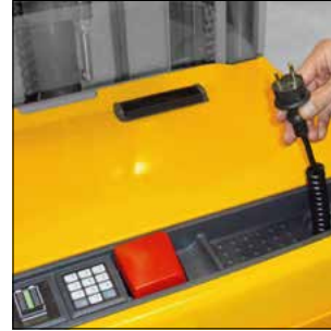
Cargador integrado para una carga cómoda de la batería en cualquier toma de corriente