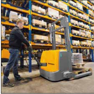
La EJC B14 apilando