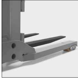
Brazo porteador con rodillo tandem basculante patentado